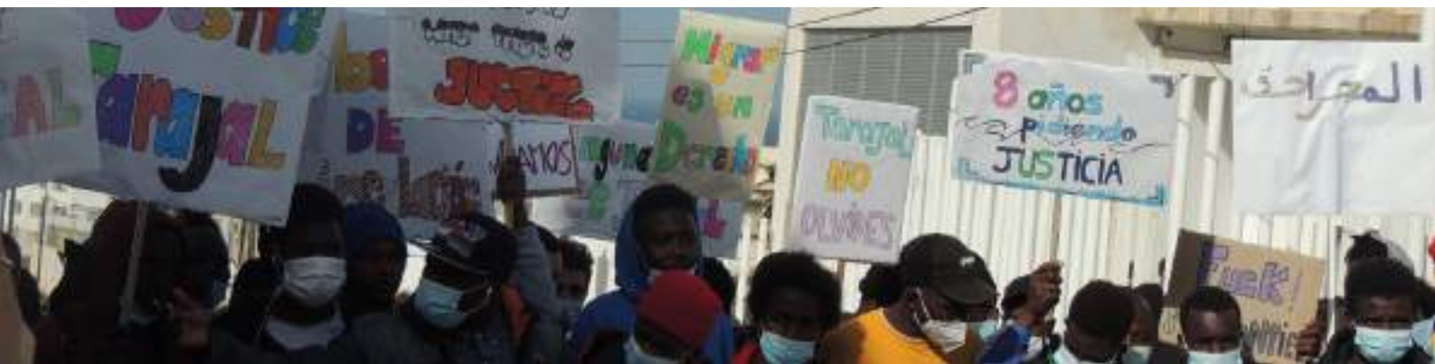
Marcha por la Dignidad, Ceuta 2022.