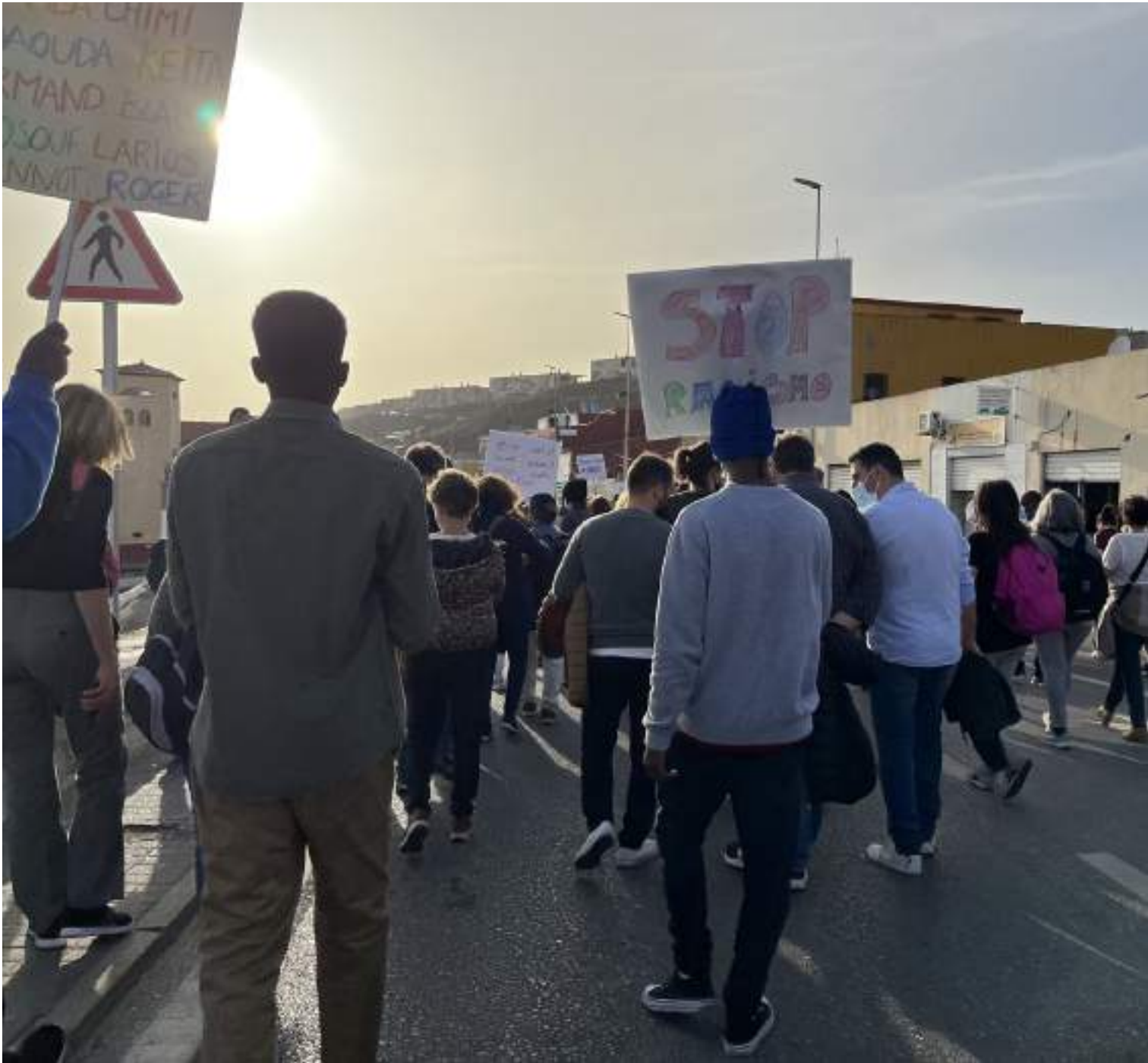
Marcha por la Dignidad, Ceuta 2022.