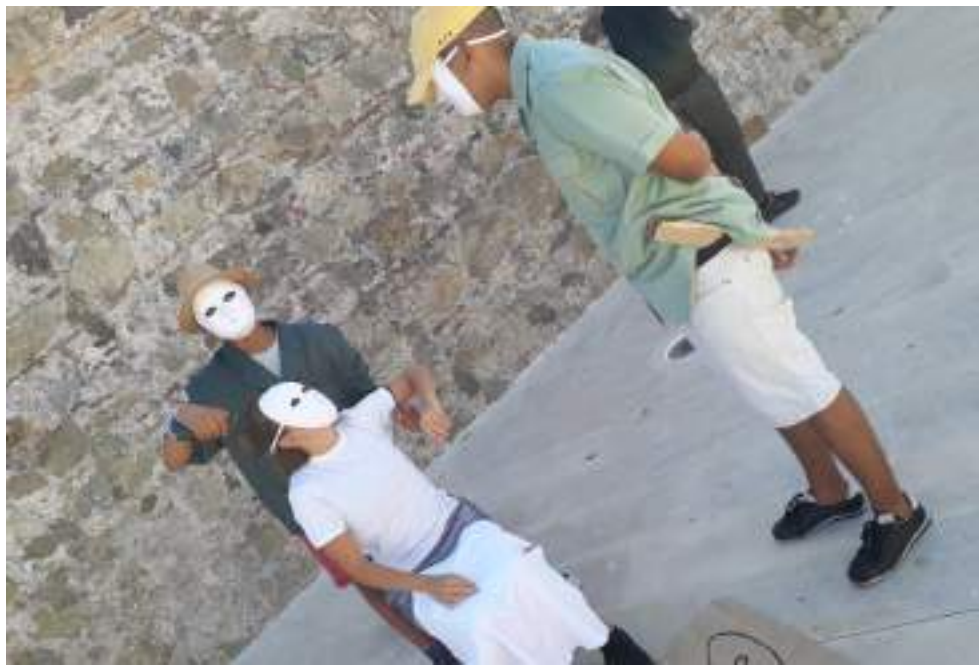
Teatro imagen denunciando públicamente los malos tratos en el Centro de Acogida La Esperanza. Maakum, 2019.