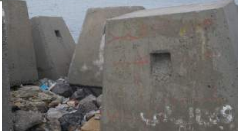
Las escolleras, "Hajar Julio". En los alrededores del puerto.

También, otros grupos han tejido redes y desarrollado otro tipo de acciones de reivindicación como la quema de las tiendas de campaña de las personas migradas en respuesta a la quema "simbólica" de colchones en Calamocarro por parte del Delegado del Gobierno para celebrar el desmantelamiento del campamento (2000), la huelga de hambre de la comunidad kurda para que les permitiesen salir de terreno ceutí (1995), las Marchas por la Dignidad desde la Tragedia del Tarajal de 2014, la denuncia pública de malos tratos y abusos en el centro de menores (2019) [ver bloque de infancia], la mudahara organizada por los jóvenes que, bien en calle o bien en las naves, exigían una respuesta a su situación (2021) o las manifestaciones en las naves de Tarajal ante la ausencia de alternativas frente a su cierre (2022).