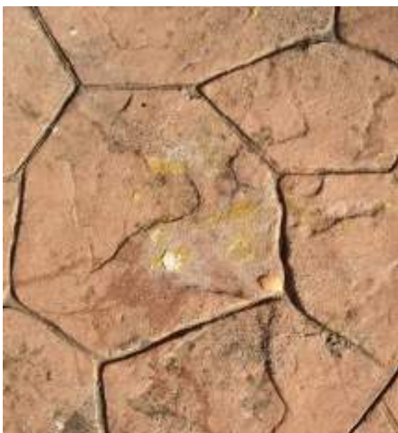
Huevos tirados a las compañeras del colectivo. 2019.

Era el cumpleaños de una de las compañeras del colectivo, habíamos comprado dos tartas que apenas llegaban para un pedazo decente para cada uno. Todos los chicos se acercaron a felicitar a la compañera, la tarta era lo de menos. Al rato aparecieron varios coches de la policía nacional. Nos dijeron que no podíamos repartir comida a los chicos de la calle, les explicamos que no era un reparto de comida sino que estábamos compartiendo una tarta..