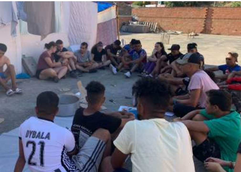
Preparación Mudahara, manifestación, 2021.