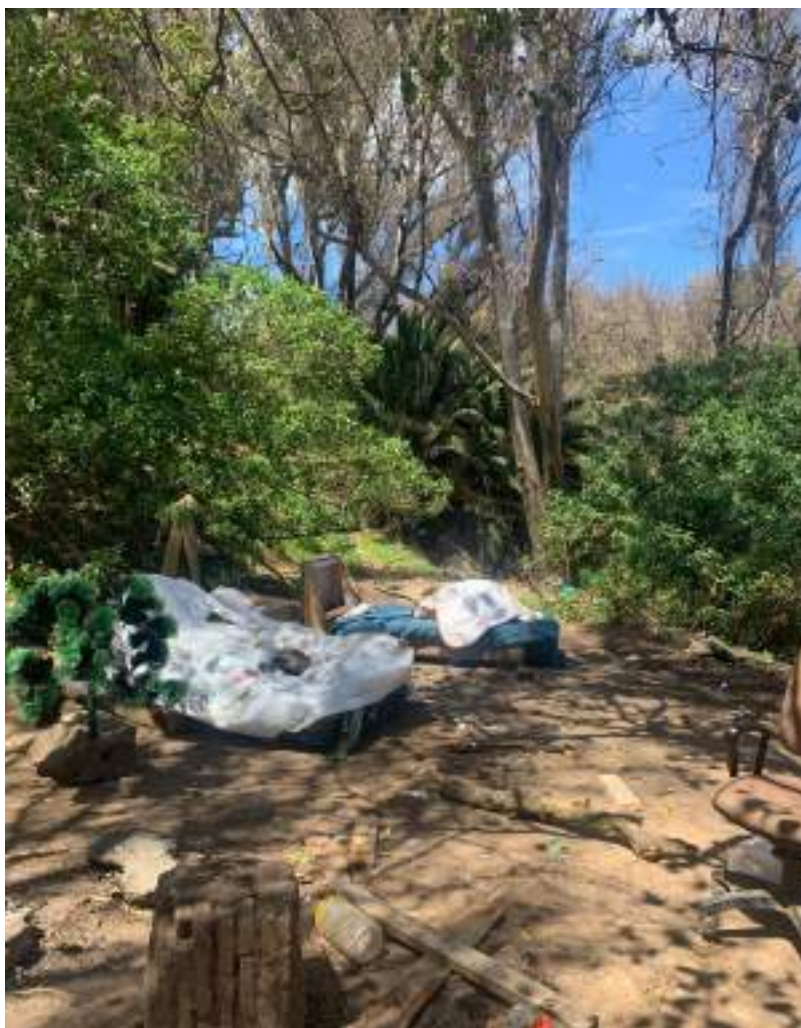
"Los tranquilos". En los alrededores del CETI.