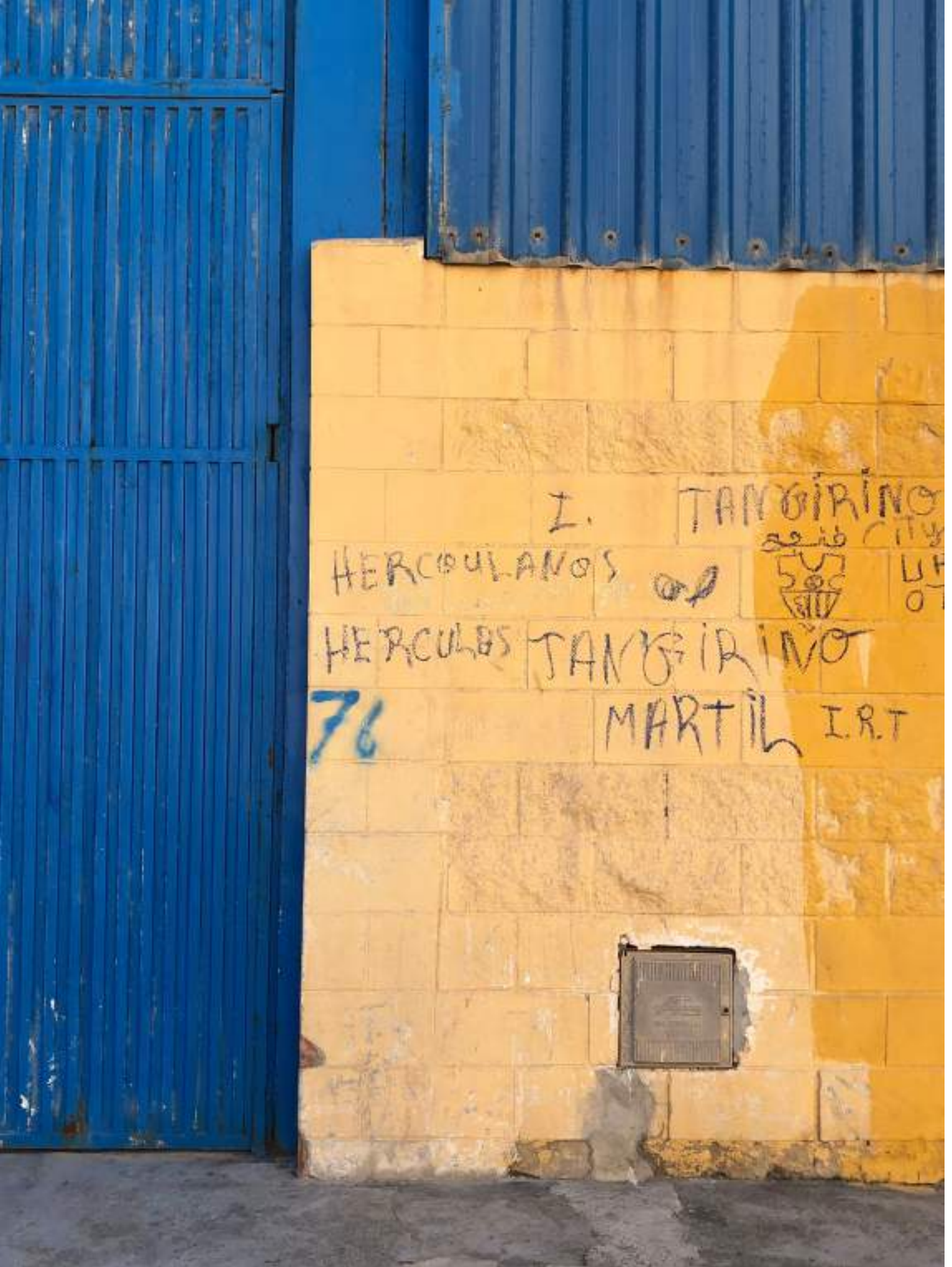
Las naves del Tarajal.