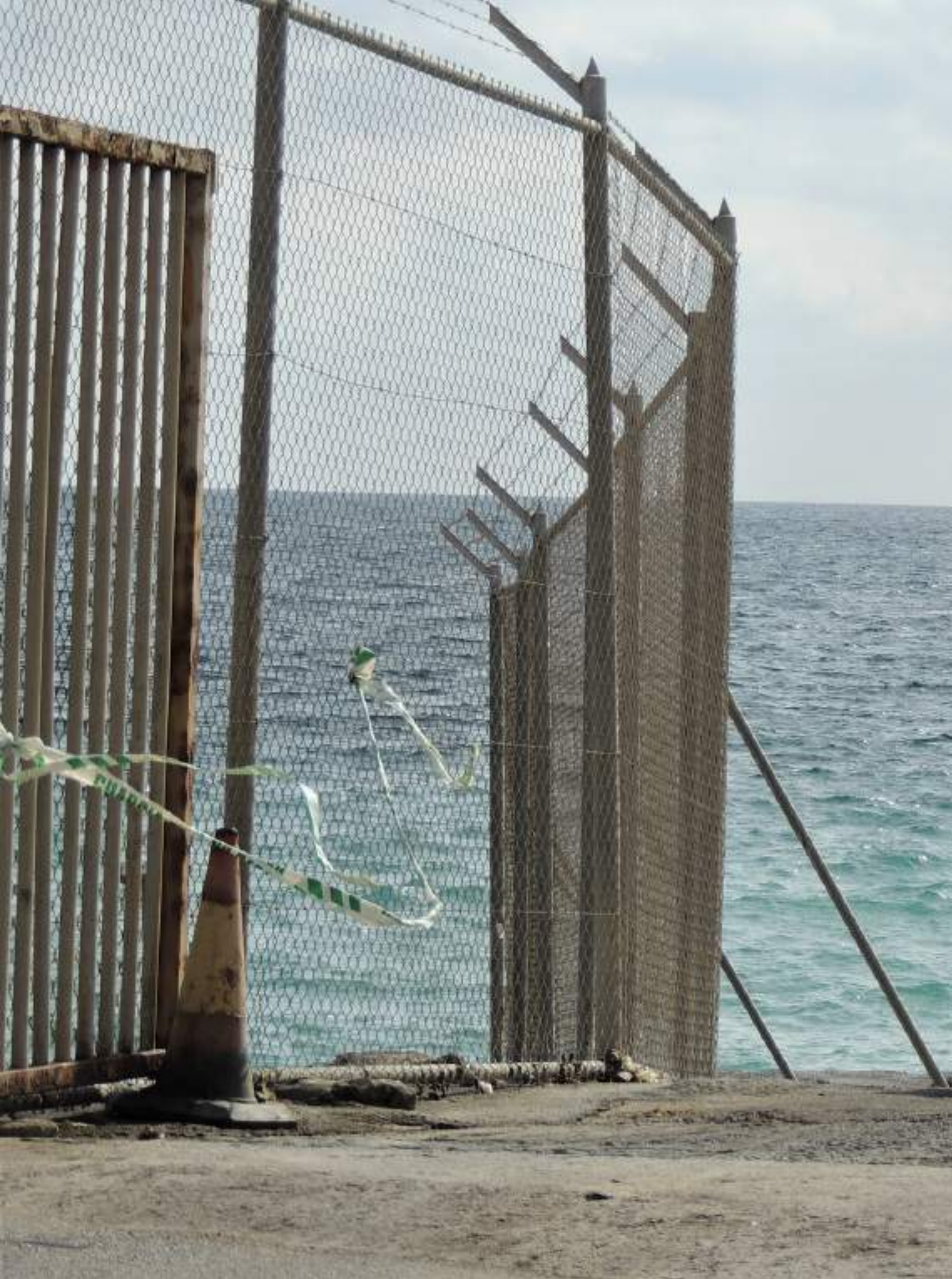
Fotografia: Sofía Picó. Maakum.